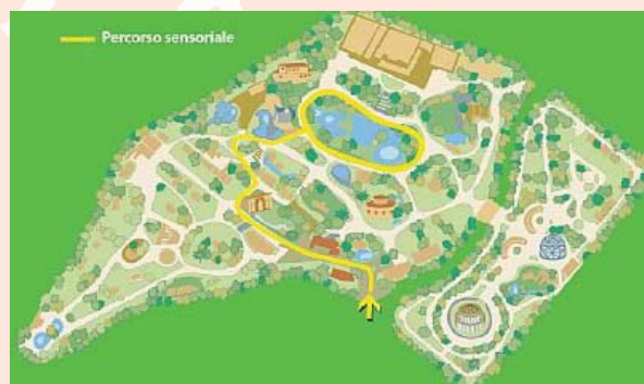
La piantina del percorso sensoriale del Bioparco di Roma

Tutti i colleghi che desiderano partecipare ai lavori sono sempre benvenuti.